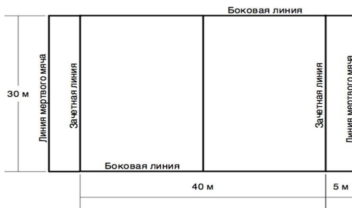
Рисунок 1 - Разметка площадки для игры тэг – регби

Линия зачетного поля - линия, за которую нужно приземлить мяч или забежать с мячом (если это предусмотрено правилами)